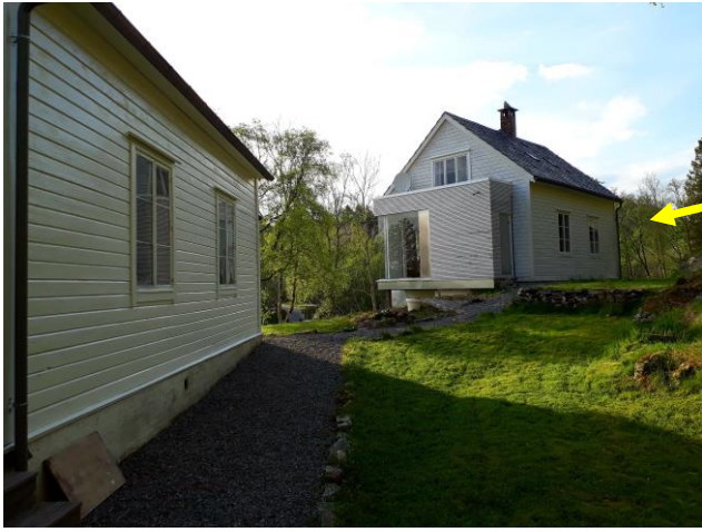
Bo og arbeidsplass